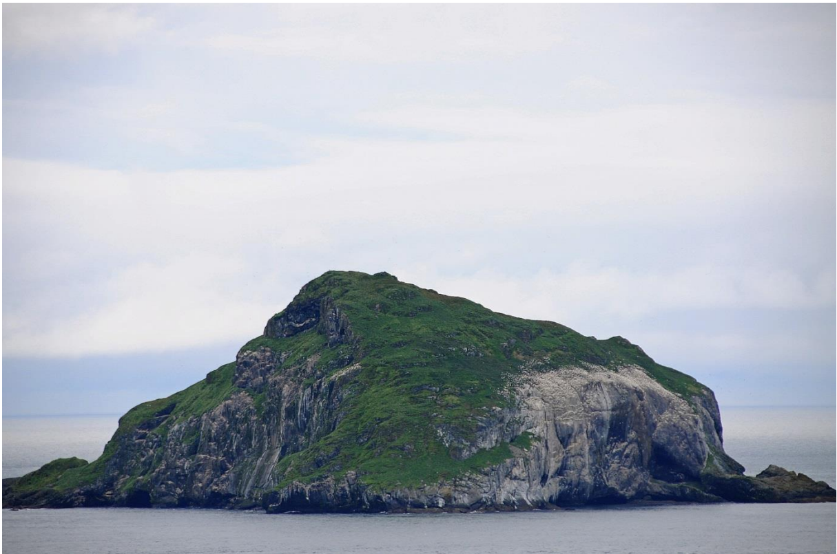
Skrúður - Aðalheiður Jónsdóttir

Í framhaldi af innleiðingu Byrjendalæsis og verkefnisins „Bættur námsárangur á Austurlandi“